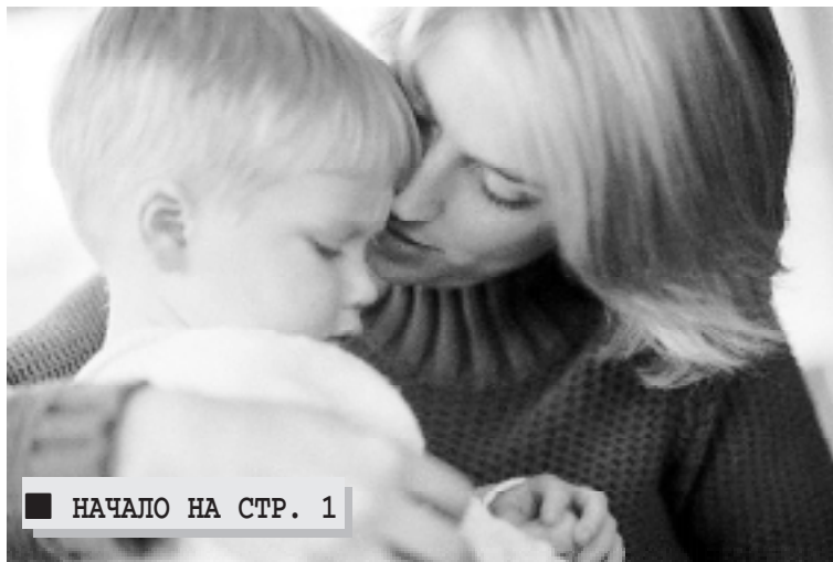
■ НАЧАЛО НА СТР. 1

Библия советует наказывать детишек с самого раннего возраста: «доколе есть надежда» . В особенности это касается наказаний физических. Мышление малышей на-